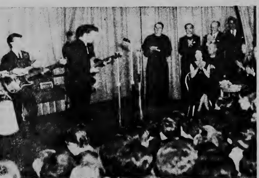
Prinses Margaret i su esposo Lord Snowdon a bai haci un bishita na Londen East End den un club di hubentud, unda Cliff Richard i Shadows a duna un funcion. E princesa i Lord Snowdon a sinta riba podio huntu cu obispo di Bath i Wells. Entusiasta nan a companja Cliff Ricards i Shadows cu batimentu di man.

Awor aki tur caminda ta tranquil atrobe den e pais, asina nan ta informa. Dos dia prome mas o menos 200 obreiro a ataca un plantashi di bacoba pa protesta contra nan onstlag. E directiva a dicidi pa muda e empresa pa un otro lugar.